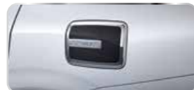
ỐP TRANG TRÍ BÌNH NHIÊN LIỆU