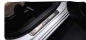
ỐP BỆ BƯỚC CHÂN