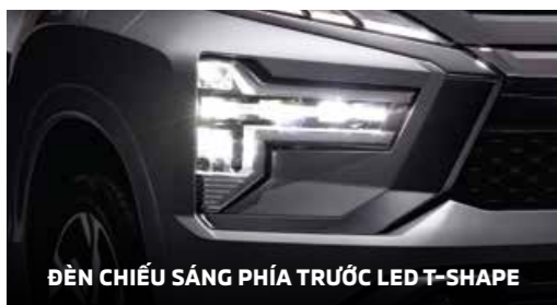
ĐÈN CHIẾU SÁNG PHÍA TRƯỚC LED T-SHAPE

Triết lý "Vẻ đẹp từ công năng" kết hợp lưới tản nhiệt, ốp cản thiết kế mới hiện đại giúp nổi bật sự sang trọng theo phong cách Crossover.