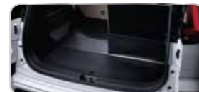
THẨM LỐT KHOANG HÀNH LÝ