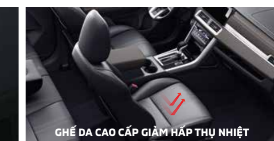
GHẾ DA CAO CẤP GIẢM HẤP THỤ NHIỆT