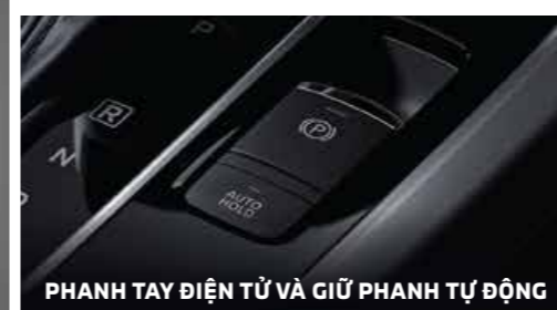
PHANH TAY ĐIỆN TỬ VÀ GIỮ PHANH TỰ ĐỘNG