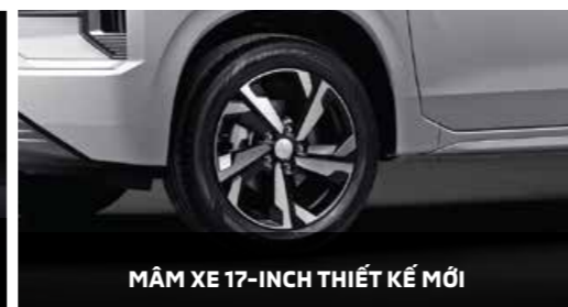
MÃM XE 17-INCH THIẾT KẾ MỚI