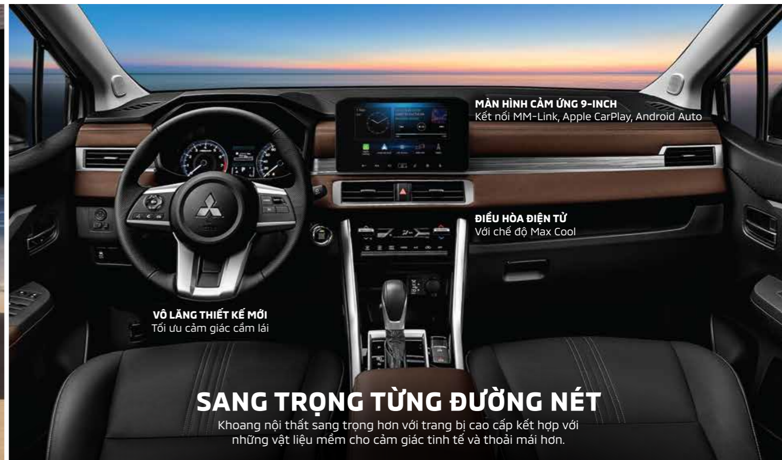
MÀN HÌNH CẢM ỨNG 9-INCH Kết nối MM-Link, Apple CarPlay, Android Auto