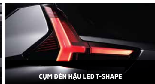
CỤM ĐÈN HẬU LED T-SHAPE