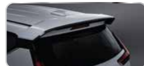
CÁNH LƯỚI GIÓ ĐUỐI XE