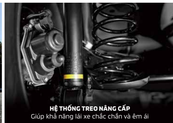
HỆ THỐNG TREO NÂNG CẤP Giúp khả năng lái xe chắc chắn và êm ái