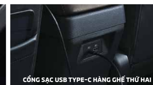
CỔNG SẠC USB TYPE-C HÀNG GHẾ THỨ HAI