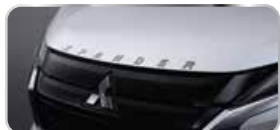
BIỂU TƯỢNG LOGO XPANDER