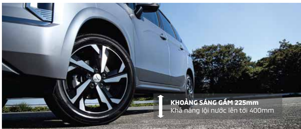
KHOẢNG SÁNG GẦM 225mm Khả năng lội nước lên tới 400mm